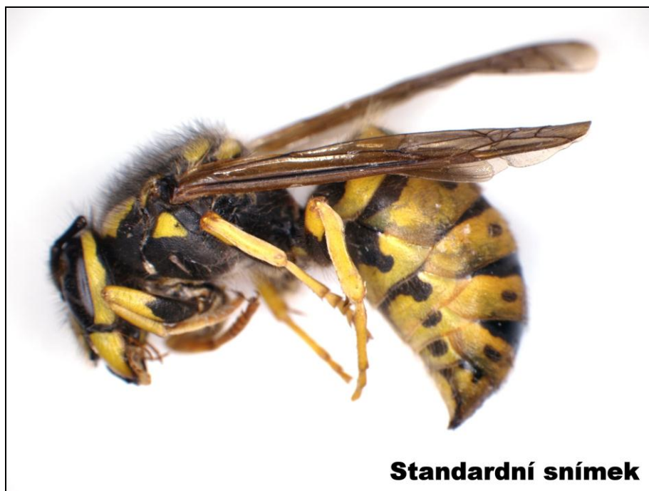
Standardní snímek s ostrou pouze vrchní částí vzorku

Softwarový modul k programům QuickPHOTO CAMERA, MICRO a INDUSTRIAL pro vytváření digitálních snímků s hloubkou ostrosti mnohem větší, než jaké je možné dosáhnout běžným použitím optických mikroskopů. Využívá se při práci se stereomikroskopy i ostatními typy mikroskopů při pozorování v procházejícím i odraženém světle. Verze Deep Focus 3.1 umožňuje proces vytváření snímků automatizovat. Modul je možné použít také pro makrofotografii.